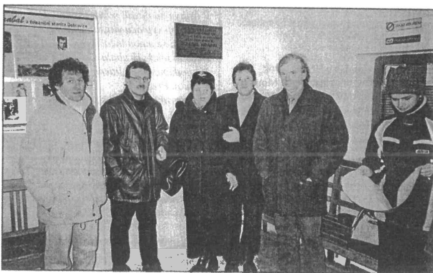
Členové Klubu čtenářů B. H. pod odhalenou pamětní deskou

- černé kalhoty, modrá blůza, kde se na líci třpytil ten nejhezčí odznak - okřídlené kolečko zdobené fialovým a modrým flitrem, podobné zlatému mořskému konikovi. Sedával u telegrafního stolu pod oknem, ze kterého bylo vidět pět kilometrů dlouhou polní cestu, roubenou starými jabloněmi, na jejímž konci se třpytil zámek knížete Kinského. Tady sedával mladý záškolák, později výpravčí a ještě mnohem později slavný, nejen český, ale světový spisovatel Bohumil Hrabal. Když němečtí okupanti 17. listopadu 1939 uzavřeli české vysoké školy, Bohumil Hrabal, tou dobou student právnické fakulty UK, se vrací domů do Nymburka. Počátkem prosince přijímá místo pomocné síly v kanceláři notáře Možuty. Nezáživná advokacie je pro Hrabala bezbřehou nudou, a tak o devět měsíců později, v roce 1940, raději nastupuje jako skladník Spotřebního a výrobního družstva železničních zaměstnanců v Nymburce. V březnu 1942 přestupuje přímo ke dráze jako výpomocný dělník. Podbíjí kolejnice, dělá pochůzkáře, slape drezínu. „To byl zlatý věk! A pěkně venku a pěkně v přírodě a pěkně s dělníky a pěkně si s nima vykládat!“