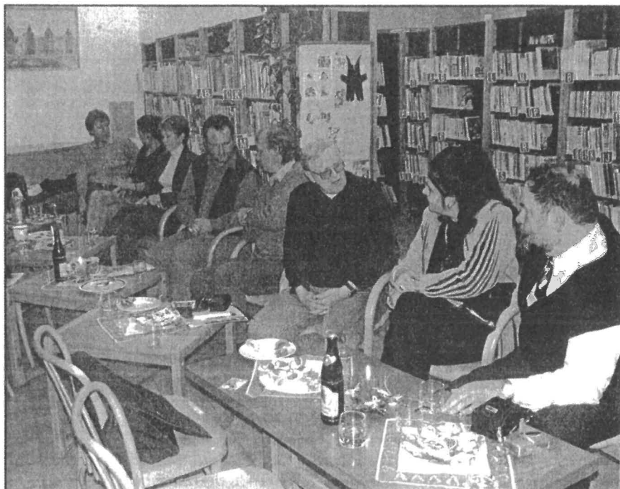
Debatovalo se nad prostřenými stoly