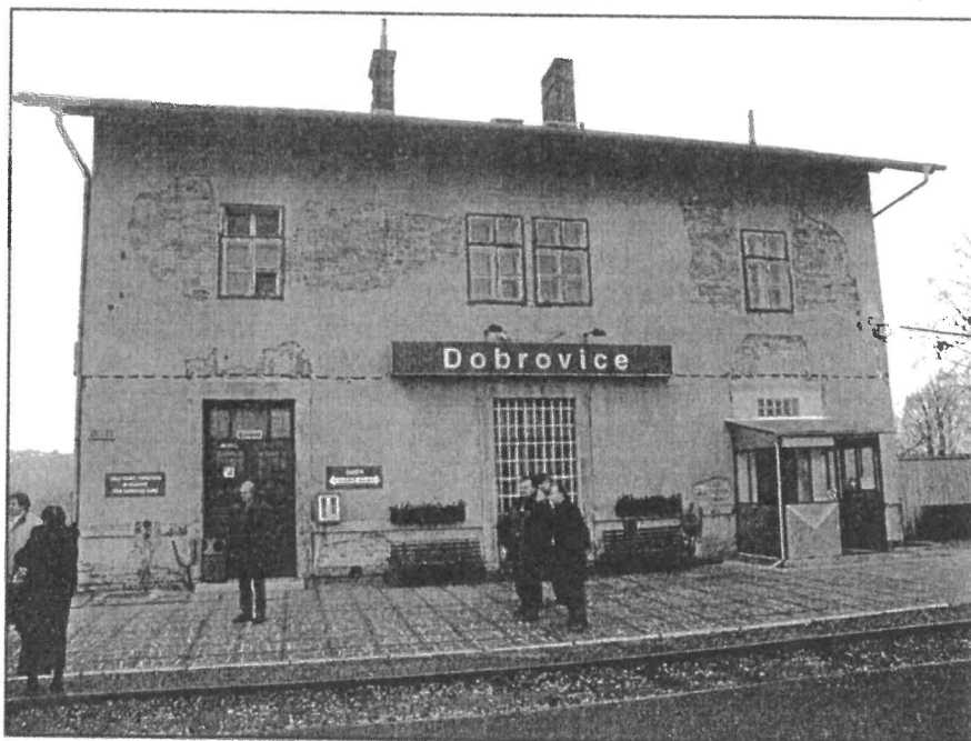
Železniční stanice Dobrovice

„Zde, na této malé a nenápadné železniční stanici, v dobách nacistické okupace, sedával mladý muž, pochopitelně v uniformě