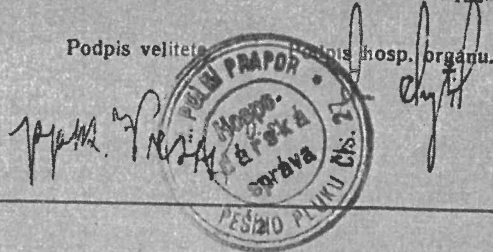
Průkaz z 1. ledna 1925