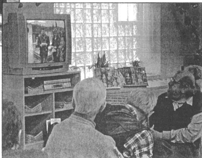
Většina z nás viděla poprvé videozáznam ze zahájení Hrabalovy devadesátky

čerstvě odhalené, zcela zvláště pojaté pamětní desky na Hrabalově rodném domě v brněnské Balbinově ulici. Pan výpravčí Pokorný představil svůj projekt - odhalení pamětní desky na dobrovické nádražní budově (viz strana 6).