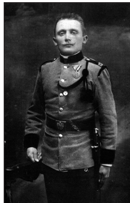
Předloha strýce Pepina Josef Hrabal.

Porotou vybrané fotografie budou vyvěšeny na web knihovny. Autoři nejlepších snímků budou vyhlášeni a odměněni diplomem a cenami 21. listopadu u příležitosti zahájení oslav 120. výročí založení veřejné knihovny v Nymburce, kde budou jejich fotografie vystaveny (následně pak na Hrabalově Kersku v roce 2016). V černobílém provedení je zveřejníme v Nymburském pábíteli.