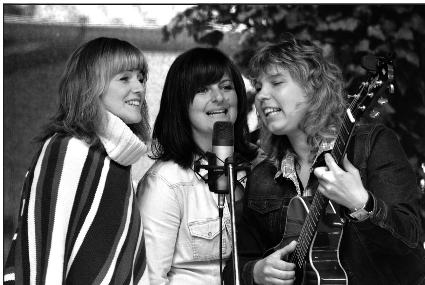
Sympatická děvčata Přelet MS.