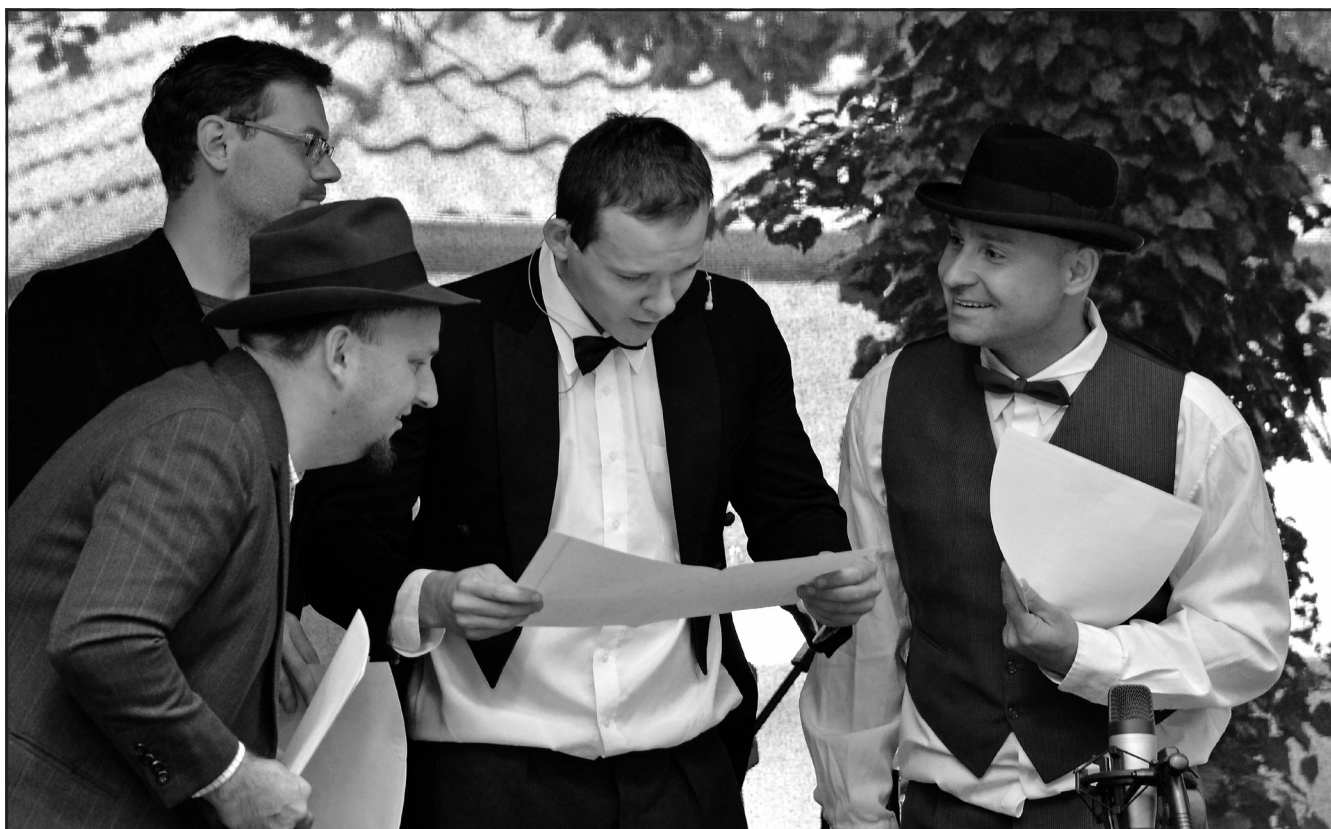
Herci z divadelního spolku Hálek v inscenaci Boganova maturita.

Na kerské straně řeky u menhiru se tedy všichni z kostomlatské strany i pochodníci