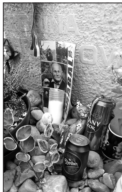
Maďarské zátíši u pomníku.