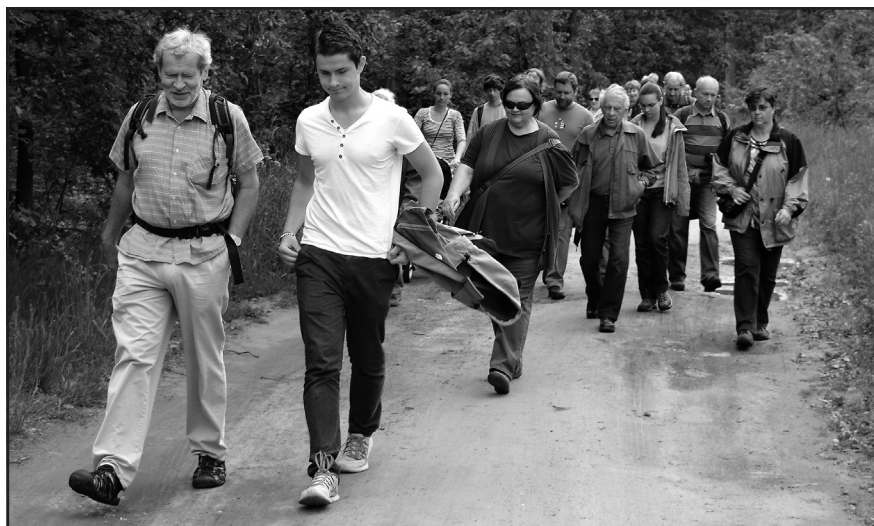
Dopolední procházka Kerskem.