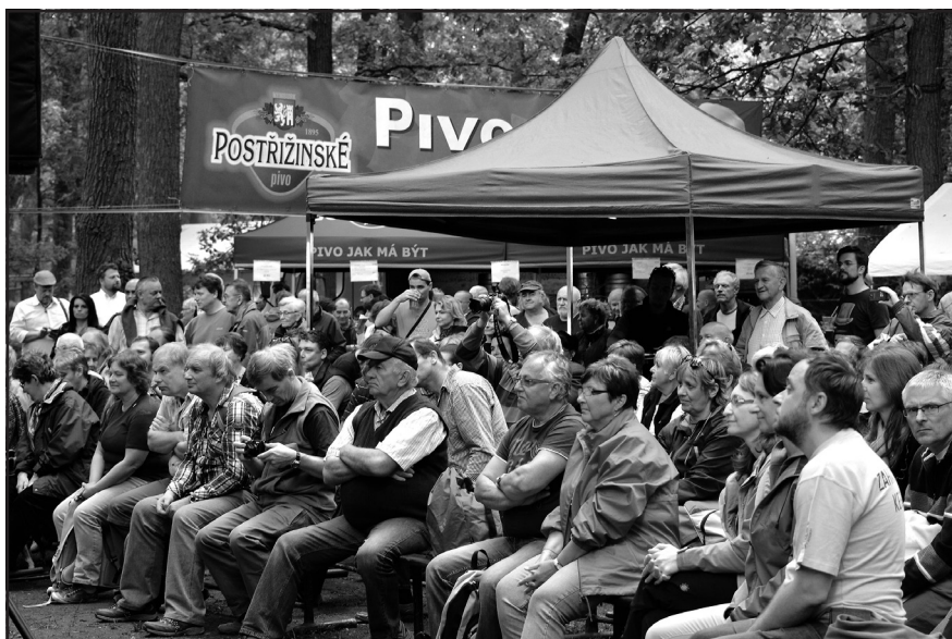
Lidé v hledišti se dobře bavili.

Kromě zábavy na jevišti, k níž patřilo i losování účastnických soutěží, se lidé, jichž se opět sešlo a sjelo několik stovek, bavili i sami. Měli k tomu vytvořené ty nejlepší podmínky. Na stáncích se točilo pivo – speciálně pro Hrabalovo Kersko vyrobil nymburský pivovar čokoládové Postřižín-