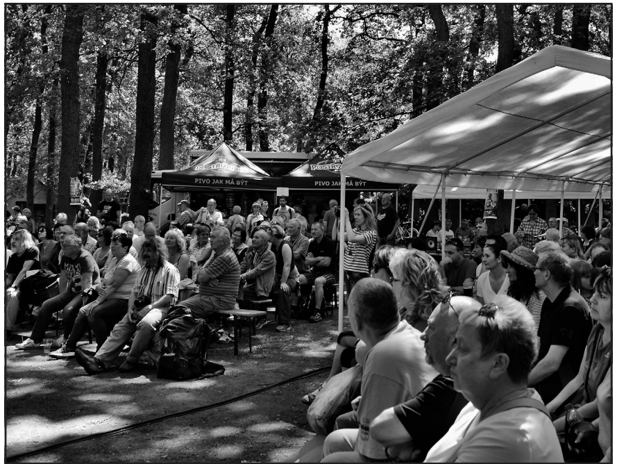
Diváci se skvěle bavili