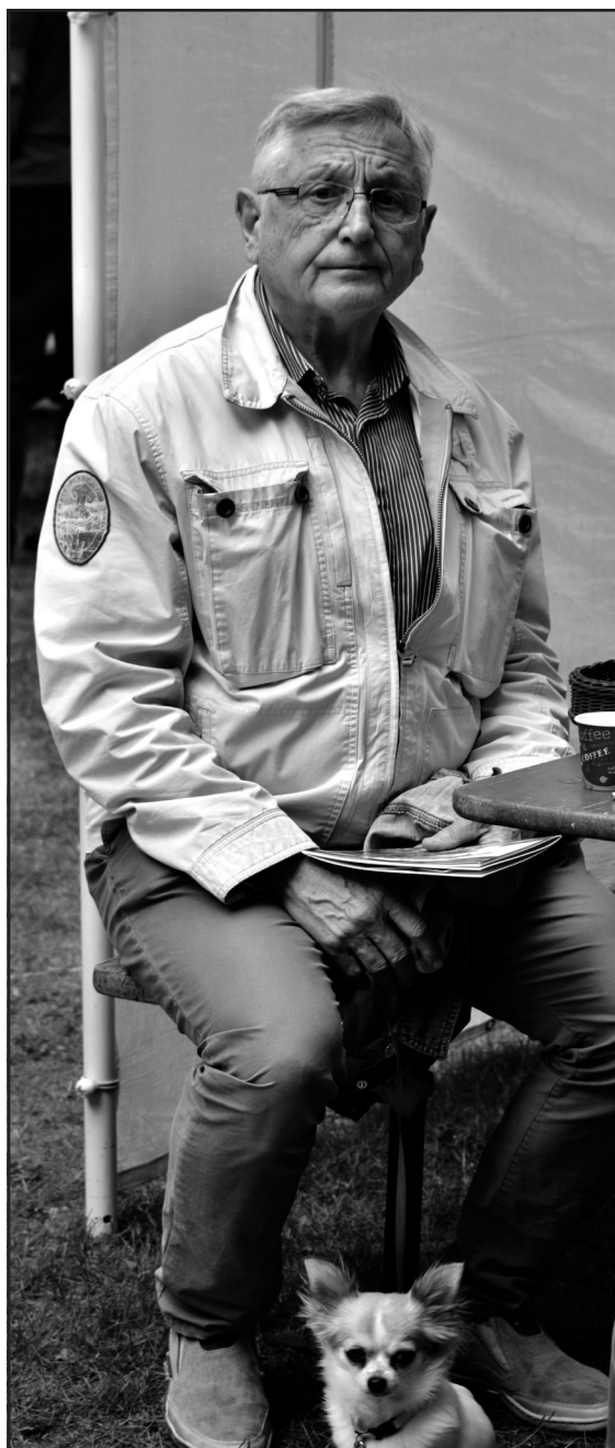
Jiří Menzel na Hrabalově Kersku

Již osmnáctý ročník Hrabalova Kerska proběhl v sobotu 21. května 2016. A znovu jsme si mohli říci, že umíme zařídit, aby svítilo slunce. To na modré obloze i to v duších všech účastníků, kterých se opět sešlo tolik, že zahrada Lesního ateliéru Kuba takřikajíc praskala ve švech.