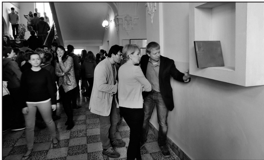
Snímek z odhalení desky pořídila Olga Vendlová

Jiří Černý, vedoucí odboru kultury nymburské radnice, zase připomněl, že se jedná už o devadesátou pamětní desku odhalenou v Nymburce.