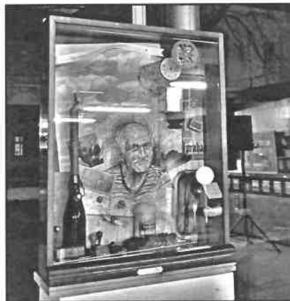
Jedna z instalací na výstavě.

Ale jednou přijde čas, kdy opravdu poletím s vámi, a potom se tam nahoře sejdem, pane Bohumil! A už teď vím, že U nebeského tygra, ve společnosti rajských piv, bude sedět i Egon Bondy, kurva fix!