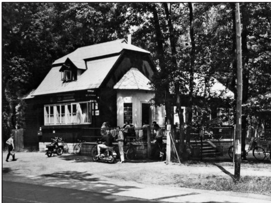
Hájenka na dobové fotografii

Některé vilky postaveny blízko betonky, jiné jsou ukryty v zahradách borových lesíků. Při pramenu Štěrdovečer-