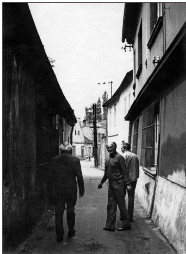
Bohumil Hrabal na procházce s přáteli ve Vodárenské uličce

Nejvíce mne ale bolí poslední práva, že Malé Valy mají být zasypány! Že stará synagoga nebude naším útlukem, že Pragoděv, Pickárna bývalá, má zájem na stavení v Eliščině třídě, že muzeum zatím má být ve starém děkanství. A přesto už myslím, a tady dávám plán, kterak tohoto roku se zřídí komise „700 let Nymburka“ pro oslavy jubilea, už letos chci vytyčit a sestavit generální plán a postup, už nyní musíme myslet na základní dlouhodobé dispozice pro výstavbu a obchod a pohostinství, a nejen to, já myslím a tady dávám návrh, že o rok později sestavíme prováděcí plán a projednání generálního a prováděcího plánu s příslušnými orgány, organizacemi, podniky a ústavy, už teď chceme organizovat kolektiv aktivu „Nymburk 700 let“, už dlouhodobě expozice průmyslové, to je ZOM a ČSD, Pragoděv a Fruta, expozice muzejní, historické jádro Severozápadní dráhy, expozice galerijní, tj. obrazové a kulturně historické, už nyní musíme myslet na rozpočet a zajištění financí, už teď je skoro pozdě udělat koncepci pro galerie a vyhlášení soutěží pro výtvarná pojetí jubilea, už teď mluvím o prodloužení ohledně vyhlášení podmínek pro soutěže literární a hudební, už dneska je skoro pozdě zajistit