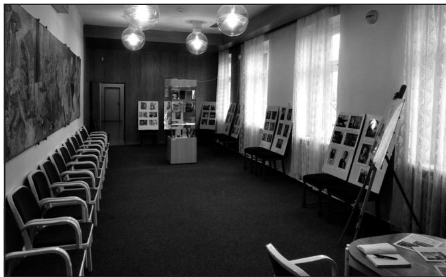
Hrabalovská výstava v České Kamenici